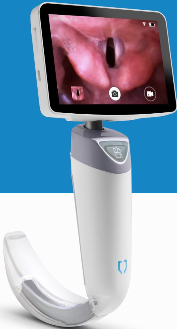
VS-10 H Vidéo Laryngoscope