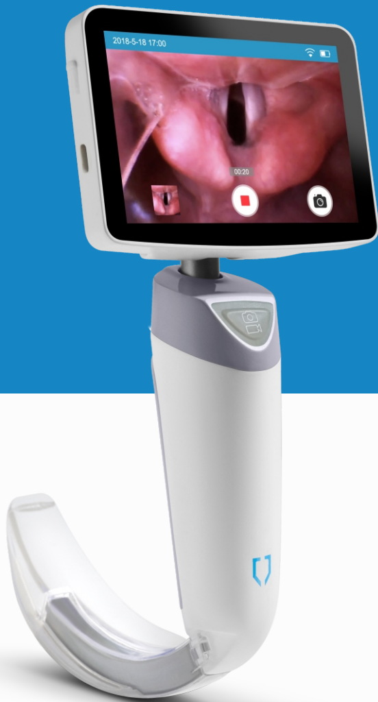
Videolaryngoskop VS-10 H