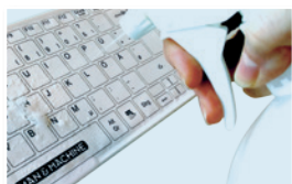
UTILISEZ DÉSINFECTANTS STANDARDS