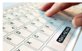
TAPEZ RAPIDEMENT ET CONFORTABLEMENT