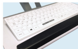
S'ADAPTE AUX CHARIOTS ET SUPPORTS CLAVIERS