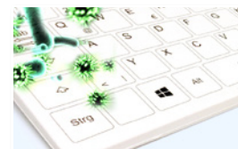
PROTECTION OPTIMALE CONTRE LA SALETÉ