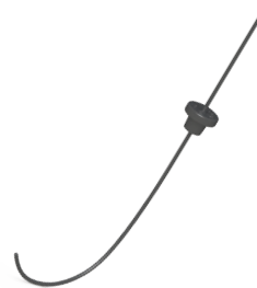
GlideRite® Einweg-Mandrin – klein