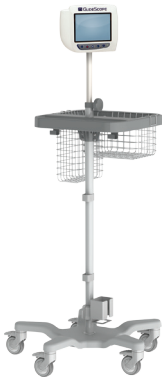
GlideScope® Premium Cart