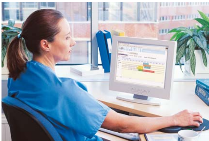
Gestion des chirurgies à l'aide du module de monitoring Opera Web

Dans l'environnement médical actuel, les médecins et les responsables de salles d'opération utilisent des outils de gestion clinique et opérationnelle pour optimiser les performances des processus périopératoires. Ces outils aident à garantir que les objectifs cliniques appropriés sont identifiés, que les ressources nécessaires sont en place, et que les processus les plus efficaces sont appliqués à l'ensemble de votre organisation. Opera propose une gamme complète d'outils sophistiqués de gestion clinique et opérationnelle qui vous permet d'atteindre ces différents objectifs grâce à une seule et même application.