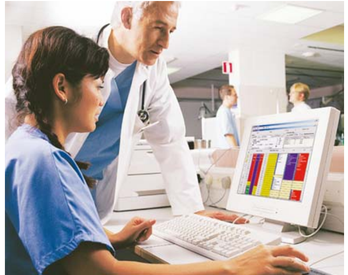
Planung mit dem Opera Planungsmodul